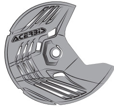
A - (1 PCS)